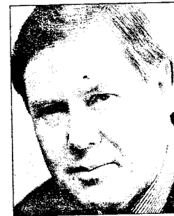
STRENG SENSUR: Norsk Regnesentral's rapport avdekker meget systematiske sensurutiner i arkivene til statsrådene Nils Totland, Hill-Marta Solberg, Kjell Opseth og Gunnar Berge. Opplysninger fjernes regelmessig, ofte stikk i strid med loven.

Noe av den samme praksisen har funnet sted i arkivet til kommunal- og arbeidsminister Gunnar Berge. I rapporten fremgår det at dokumentene er blitt sladdet rutinemessig.