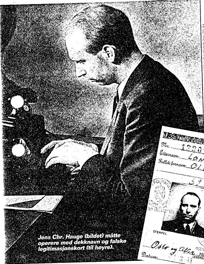
Jens Chr. Hauge (bildet) måtte operere med dekknavn og falske legitimasjonskort (til høyre).

Den som deltok i illegalt arbeid, gjorde et valg med livet som innsats. Ingen nordmann hadde erfaring med illegalt arbeid fra før, men fem års motstandskamp endte til slutt med seier. – Vi gjorde mange feil, men vi lærte faget. Det tok lang tid og kostet mange liv, forteller Jens Chr. Hauge, Milorg-sjefen som stod svært sentralt i arbeidet for Norges frigjøring.