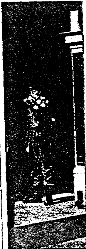
KRIGENS FALNE: De hedres best ved at man gjør opp for etterkrigstidas urett.