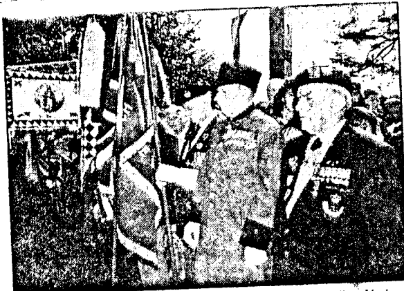
Ehemalige Offiziere der 8. britischen Armee bekundeten ihre Verbundenheit mit Kärnten und der Ulrichsbergfeier.