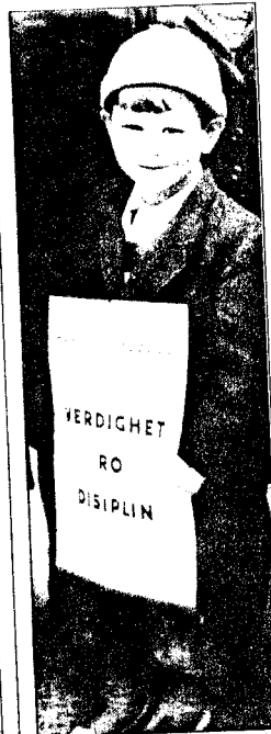
OPPFORDRING: Store og små deltok i feiringen.

For første gang dukker norske hjemmefrontkarer opp. «Gutta på skauen» er kommet til byen. I gensere, vindjakker og nikkers. Bevæpnet med maskingevær og pistoler. Og