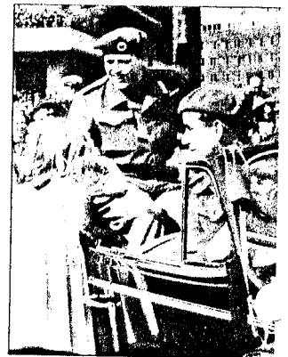
KRONPRINS OLAV: 13. mai kom kronprinsen til Oslo.

I byen ryktes det at «Stemmen fra London», redaktør Toralv Øksnevad, ventes med tog fra Sverige. Folk strømmer til Østbanen. Når han dukker frem, ropes det: