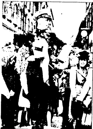
OPPTOG: Gatene var en sammenhengende bølge av gledesutbrudd.