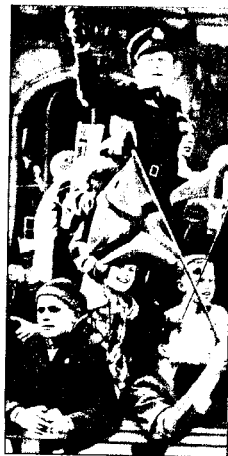
FLYVER: Hjem i triumf.

«Kolossale menneskemengder på benene. Flagg og norske farver i alle fasonger og størrelser. Voldsom begeistring overgår alle 17. maier. En engelsk offi-