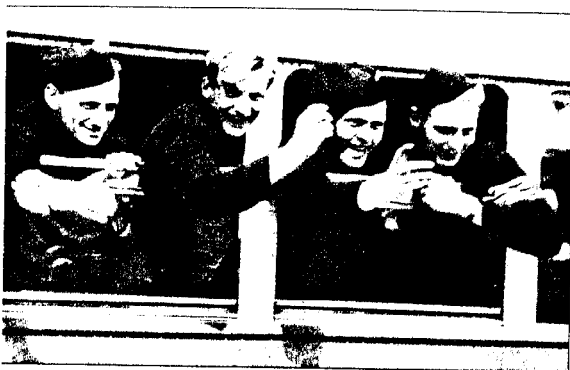
Fangene fra Grini ble hyllet som helter.

«Force 134» med kronprins Olav inntar Oslo den 13. mai. På toppen av en åpen bil hyldes han av en jublende hovedstad. Aldri var våren vakrere.