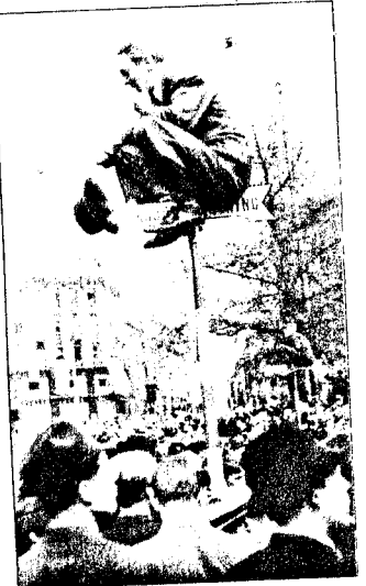
TRENGSEL: Bedre oversikt på et trafikkskilt.

ledelse er det enormt viktig å få disse kritiske dagene til å gå uten væpnede konflikter. Nordmenn blir anmodet om ikke å ta saken i egne hender. Parolen lyder: «Disiplin, ro, orden og verdighet.»