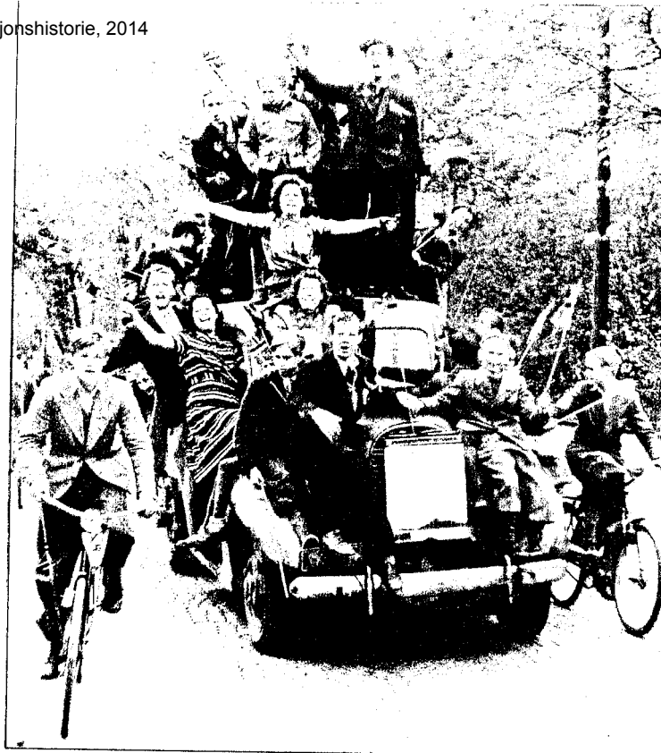
HURRA-BIL: Jubelen trillet på fire hjul i alle gater.

Karl Johans gate er som et bølgende hav. Folk strømmer inn fra distriktene. «Stengt på grunn av glede» står det i et vindu. Lastebiler stappfulle av barn med flagg. «Hurra-biler» i alle gater. «Spar lastebilene til nyttig kjøring» anmodes det i Oslo-pressen. «Ingen bil må brukes til fornøyleskjøring. Særlig gjelder det den utbredte kjøringen med barn.»