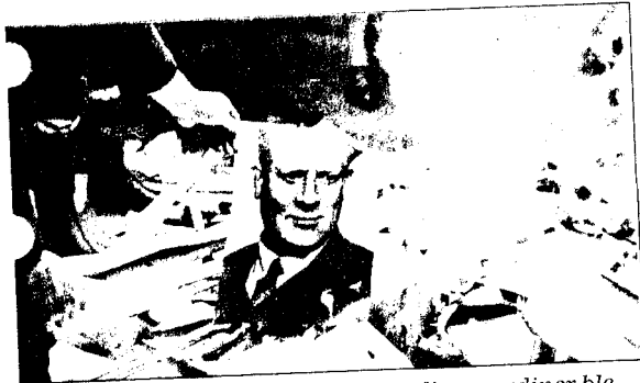
BÅL: Nazi-symboler og blendingsgardiner ble kastet på bålet.

Aldri var våren vakrere, men fremdeles er krigen en del av hverdagen. Så sent som 5. mai holder Quisling en radiotale. Den gir ikke noe håp. En hard kjerne nazister forsøker å skape forvirring. De trykker falske illegale aviser og truer med borgerkrig.