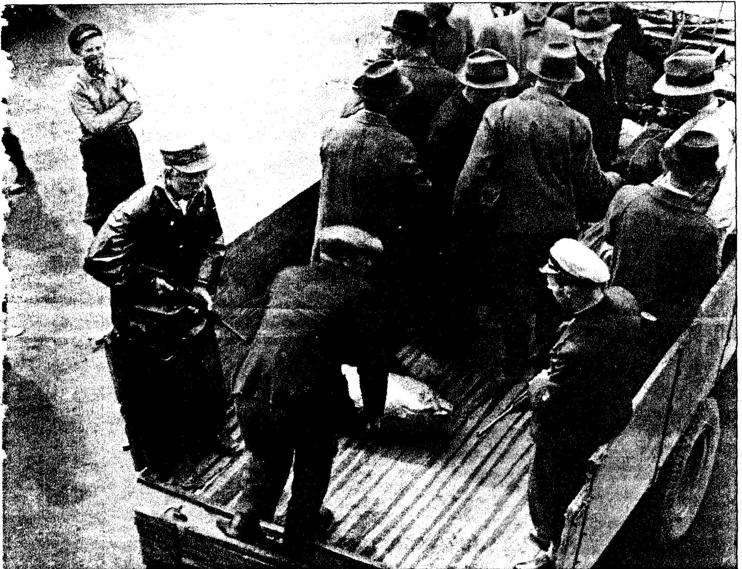
hadde lidd, i fengsel og leirer, på sjøen eller i styrkene, har i sine memoarer gitt uttrykk for denne erfaring: De skjermtes. De ivrigste hevnerne var de som hadde gjort minst. Her blir

står igjen med seierens palmer - i alle fall i egne øyne.