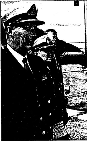
MARINEN: Kongen kom til Oscarsborg med en av marinens MTB-er, og ble tatt imot av festningens kommandant, kommandørkaptein Tor Hovland.