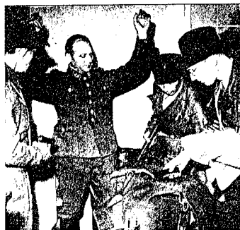
Så sent som 31. mai 1945 ble denne SS-offiseren sammen med syv andre offiserer og en kvinne tatt til fange av norske hjemmefrontssoldater i hovedkvarteret til sjefen for Gestapo i Norge, like utenfor Oslo.