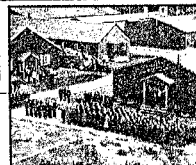
7. mai: freden har nådd Grini fangeleir.