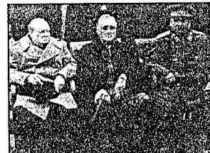
Det berømte «familiebilde» fra Jalta. Churchill (t.v.), Roosevelt tydelig merket av sykdom og en seiersstikker Stalin (t.h.)

● Som Hitler hadde bestemt, overtok storadmiral Dönitz som regjeringssjef etter Hitlers død. Hans jobb var å avvikle Det tredje riket. Tyskeme kapitulerte på betingelsesløst på alle fronter: 2. mai i Nord-Italia, 4. mai i Nederland, Nord-Tyskland og Danmark (Bildet t.v.). Den 7. mai fulgte den endelige kapitulasjonen da general Jodl undertegnet kapitulasjonspapirene for samtlige tyske hærsstyrker i Reims. Dagen etter ble seremonien, etter russenes ønske, gjentatt i Berlin. Krigen var over i Europa.