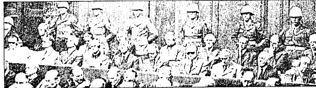
På tiltalebenken i Nürnberg satt Det tredje rikets politiske, militære og økonomiske ledere.

ingens mobiliseringsordre, etableringen av NS-styret med seg selv som minister-president fra februar 1942, nazifiseringsfremstøtene, arbeidet for å skaffe frivillige til tysk krigstjeneste, aktiv medvirking til arrestasjon og deportasjon av de norske jødene, og ansvaret for henrettelser. På bakgrunn av disse graverende forhold la aktør ned påstand om lovens strengeste straff – dødsstraff. Den omfattende rettsaken endte med at Løgmannsretten dømte Quisling til døden. Dommen ble opprettholdt av Høyesterett, og 24. oktober 1945 ble Quisling henrettet ved skyting.