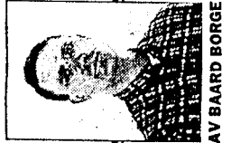
AV BAARD BORGE

at det var klare forskjeller avhengig av sosiale lag yrkesgrupper og hvor i landet de dømte bod-