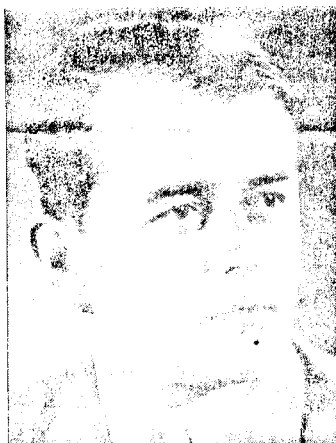
AMBISIØS: Den staute og lett aristokratiske Speer var antagelig så nær det tyske ideal som østerrikeren Hitler kunne tenke seg.

” Så besatt var han av sin egen djevleutdrivelse, at barna ikke orket å ha stort med ham å gjøre, for han kretset bare om dette ”