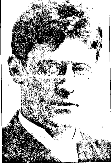
ENGASJERENDE: Den unge forfatteren Knut Hamsun var både engasjert og engasjerende. Noe som kom til å prege mer enn hans forfatterskap.