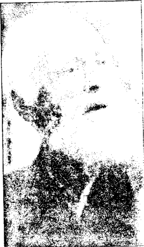
DEN GAMLE: Knut Hamsun – 91 år.

Hvorfor er det fortsatt så sterke aversjoner mot Hamsun i talefore deler av norsk opinion, enda det snart er 50 år siden vår «litterære almenhet» kvittet seg med problemet, spør vår anmelder av en bok om norsk presses behandling av dikteren i de første etterkrigsårene.