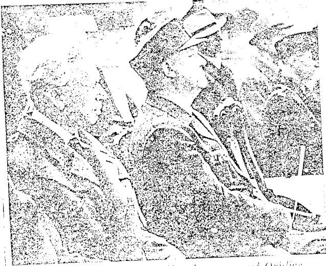
Rasmussen fotografert på Stiklestad sammen med Quisling.