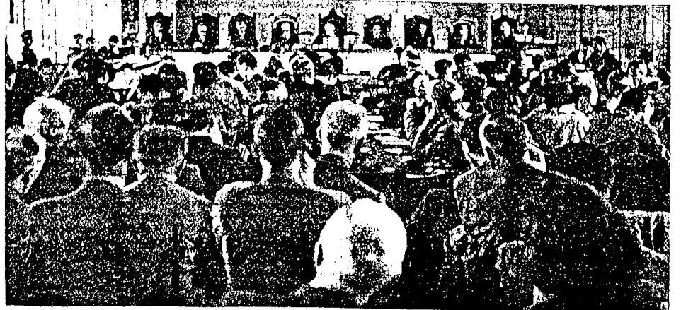
Da prosessen mot Quisling ble åpnet i går formiddag.

«Til dette kommer sin endelig tilfalle for seg personlig og på forhånd seg endelig og norske midler, bl. a. fra sluttet norske Selskap, de politiske partier osv. Ved siden av dette lot Quisling betale til seg, ministrene og