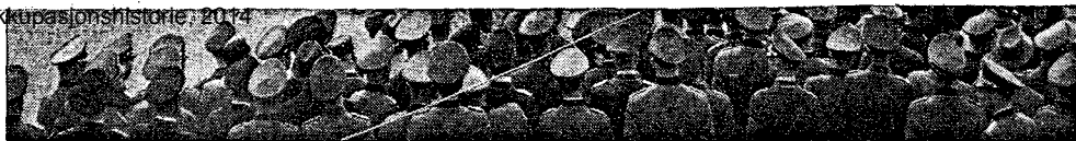
Den nazi-tyske okkupasjonsmakt er forlenget på plass, her foran Universitetet i Oslo høsten 1940. Kan det forskes «verdneøytralt» i denne delen av vår historie? Eller

SØRENSEN: — NS er den eneste gruppen som har forsøkt å gjøre revolusjon her i landet siden 1814. Jeg tror man vil finne mange interessante trekk ved Nasjonal Samlings revolusjonsforskning om man sammenligner det med andre revolusjonsforsøk rundt omkring i verden, uansett ideologisk karakter. Dertil kommer at nazismen er et av de viktigste fenomenene i vår tid. Det tror jeg ikke det kan være noen som helst tvil om. Det har vært påfallende liten interesse for nazismens idéverden, sammenlignet med et hvilket som helst annet aspekt. Det er uheldig. Hvis det er noe fenomen der idéene har spilt en sen-