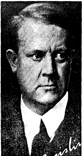
generasjon spør seg om ikke en figur som Vidkun Quisling (i midten) og hans parti også må underlegges «objektive» forskningskriterier.