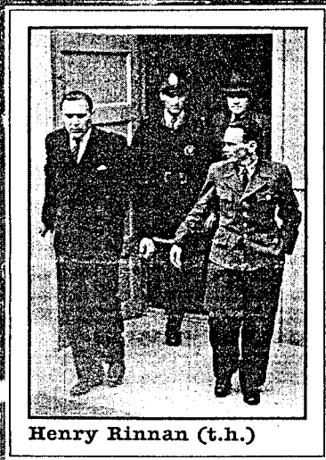
Henry Rinnan (t.h.)

■ Josef Terboven, Vidkun Quisling, Henry Rinnan, Jens Chr. Hauge. Hva vet dagens nordmenn om rollen disse fire spilte under den annen verdenskrig i Norge?