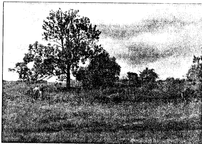
Kirkegården i Krasnoje Selo ble fullstendig slettet etter krigen. I dag er det trær og grønnsaker i området.