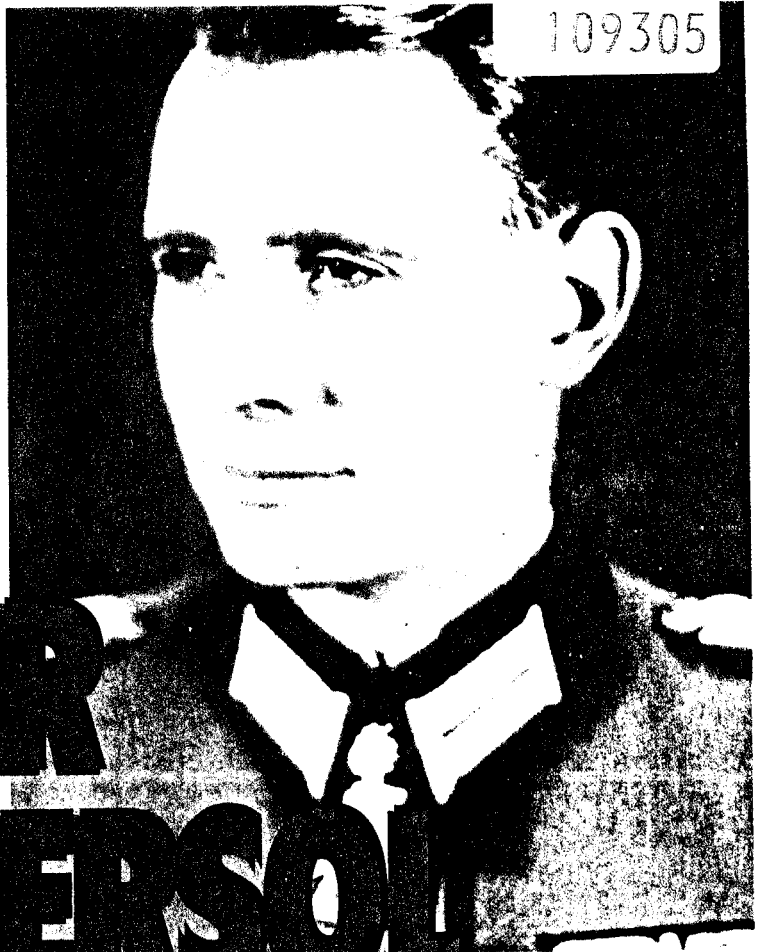
Remer under krigen.

Otto Ernst Remer sikret seg en plass i verdenshistorien 20. juli 1944. Hans dype tro på Hitler hjalp Føreren å beholde makten etter et attentat som var iverksatt av en gruppe opprørske generaler.