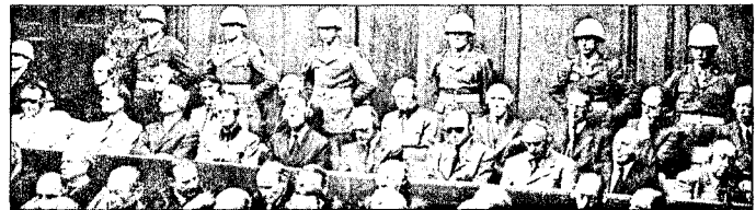
På tiltalebenken i Nürnberg satt Det tredje rikets politiske, militære og økonomiske ledere.

En rekke bedrifter og personer hadde under krigen utnyttet okkupasjonen til å tjene store penger. Brakkebaroner, personer som tjente store penger på å bygge for tyskerne, var et kjent begrep. Landssvikanordningen rammet også slik virksomhet, men i praksis ble bare vel 3 300 dømt for økonomisk landssvik, snaut 800 fikk fengselsstraff. Og