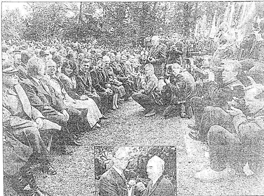
Ein Riesenaufgebot von Fotoreportern verfolgte die Feier in Erwartung irgendwelcher Mißtöne

Aus der schmerzvollen Vergangenheit für die Zukunft zu lernen.