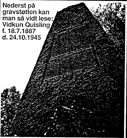
Nederst på gravstøtten kan man så vidt lese: Vidkun Quisling f. 18.7.1887 d. 24.10.1945