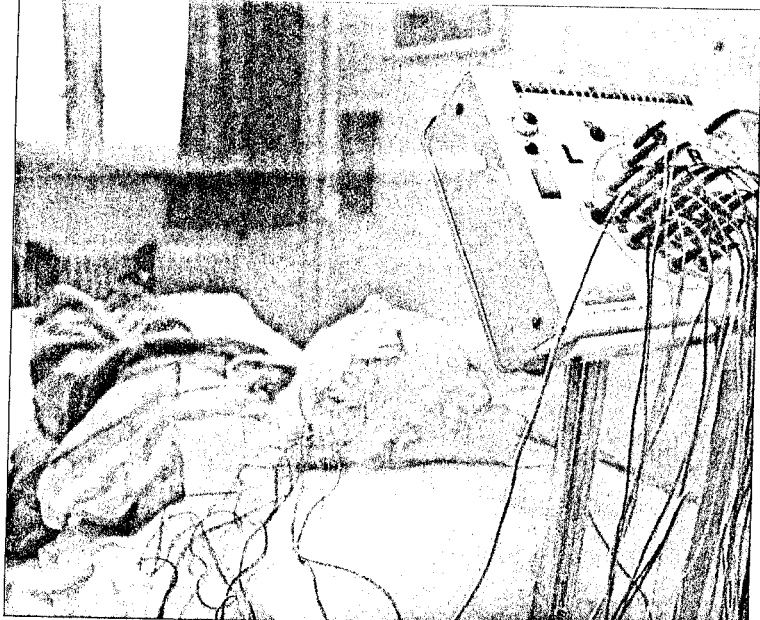
SPECT: Slik ser en spesialdesignet SPECT-maskin ut. Den måler blodgjennomstrømmingen i pasientens hjerne. Maskinen kan påvise bl.a. svinger, epilepsi og symptomer på truende hjerne slag.

Det gamle EEG-apparatet står i dag på utstilling i neurologisk avdeling og ser med sine mange brytere og visere håpløst gammeldags ut.