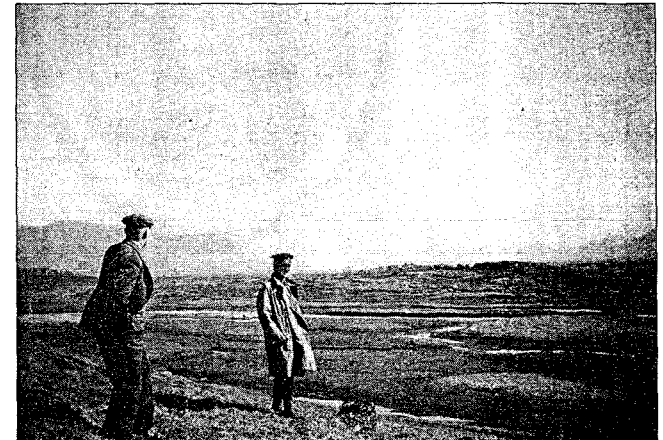
BESØK: På vei fra London til Canada besøkte general Fleischer de norske styrker i Island og Jan Mayen. Her er han i Island.

” Jeg vet ikke hvad jeg skal gjøre eller hvordan jeg skal leve ”