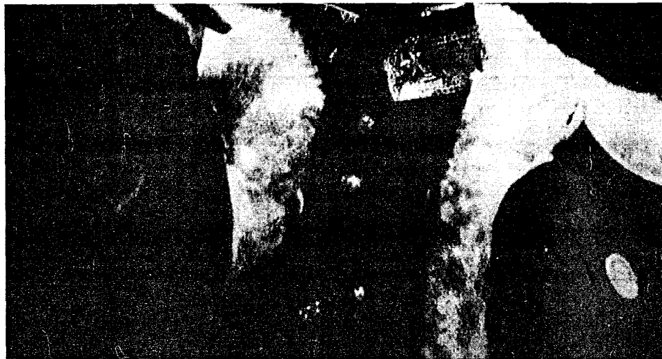
GENERALEN: General i mai 1940, mens han ledet 6. Divisjon. Divisjonen sto klar til å sette inn det endelige, avsluttende angrep mot tyskerne i Nord-Norge.