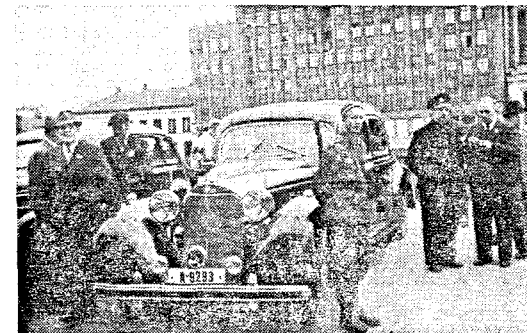
Quisling er arrestert. Her har han nettopp forlatt bilen sin, for å bli forført i politistasjonen i Møllergaten 19 i Oslo.