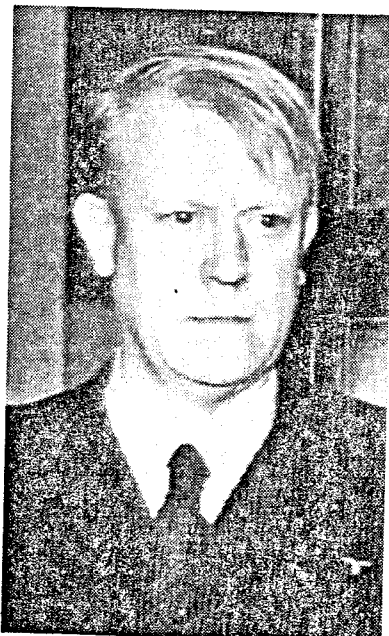
Vidkun Quisling, ifølge Goebbels en germansk patriot med god vilje, men udugelig og en belastning for tyskerne.

Til Goebbels' store overraskelse valgte kong Haakon å slå inn på kompromissløs motstand fra første dag; det stikk motsatte av hva broren og kollegaen i København, Christian den tiende gjorde. Dansk kongen er da også utmerkede karakterer av Hitlers propagandaminister. Quisling heter det at han var en germansk patriot med god vilje, men at han var udugelig og en belastning for tyskerne.