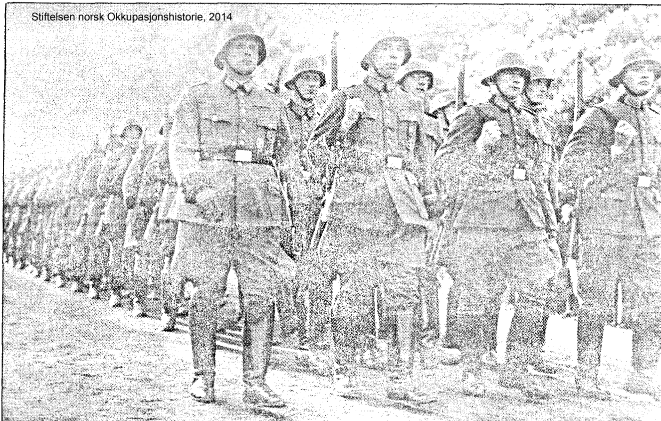
Hitlers tropper på norsk jord i april 1940.

for vestmaktene var imidlertid at blokaden hadde store hull. Den tysk-sovjetske pakt betydde ikke bare at Hitler fikk grønt lys til å angripe Polen, men også at Tyskland fikk tilgang til krigsviktige råstoffer. For å opprettholde det gode forhold til Tyskland la Stalin stor vekt på å forsyne Tyskland med de varer det trengte. Her var oljen fra Kaukasus av ganske spesiell betydning.