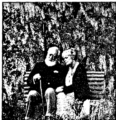
FRED: Først da Knut Hamsun bare hadde få dager igjen å leve, kunne freden senke seg over ekteskapet med Marie. Et langt og tornefylt liv ebbet mot slutten. Meget godt skildret av svenske Max von Sydow og danske Ghita Nørby i filmen «Hamsun» som har verdenspremiere på Sagatun i kveld.