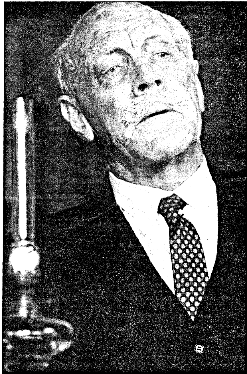
PORTRETT: Nei, dette er ikke originalen. Dette er ikke Gustav Heibergs legendariske bilde fra rettsaken mot Knut Hamsun. Det er derimot Max von Sydow i en uforlignelig karaktertegning av den gamle dikterhøvdingen hentet fra filmen «Hamsun» som har verdenspremiere på Sagatun i kveld.

Tilbake til filmen: For landsmenn av Hamsun vil den svensk/ dansk/norske filmen valde litt smerte. Det gjør vondt å bli minnet