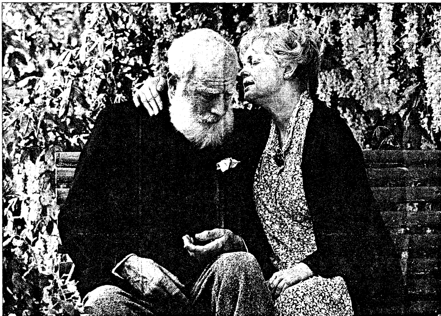
UNDER GULLREGNEN: Knut og Marie Hamsun i Max von Sydows og Ghita Nørbys skikkelsér i hagen på Nørholm. Bildet nedenfor viser de virkelige Knut og Marie samme sted.