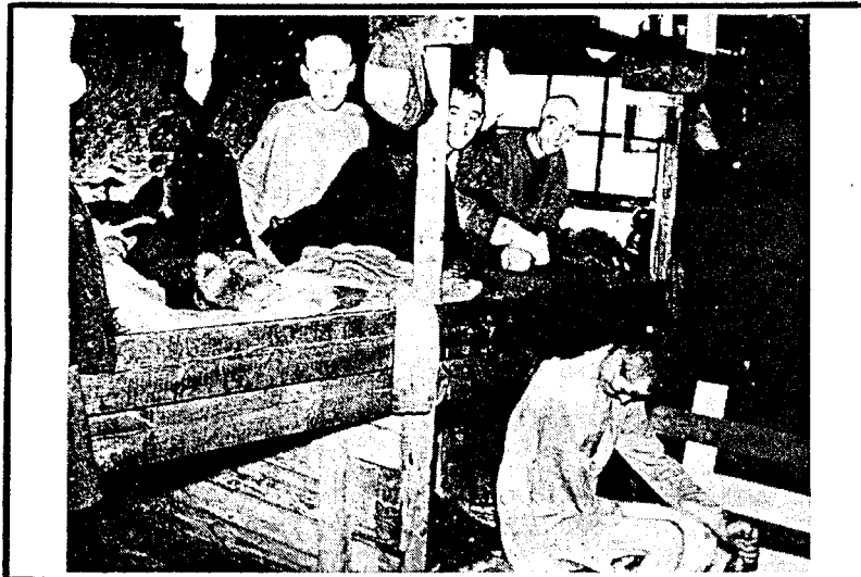
Sovjetiske krigsfanger i en leir i Finnmark.

Tyskerne behandlet dem slik: De tok naturligvis livet av dem – men hvordan? Den første fikk nese og høyre øre skåret av. Så ble testiklene skåret av. Neglene på venstre hånd ble trukket ut. Han døde av svære og dype stikk på kroppen, bl.a. et 6 cm dypt stikk opp i ganen. Han var altså spiddet på en bajonett inn gjennom munnen. Liket ble kastet i en søppelgrav og lå der i tre dager før det ble gravd ned.