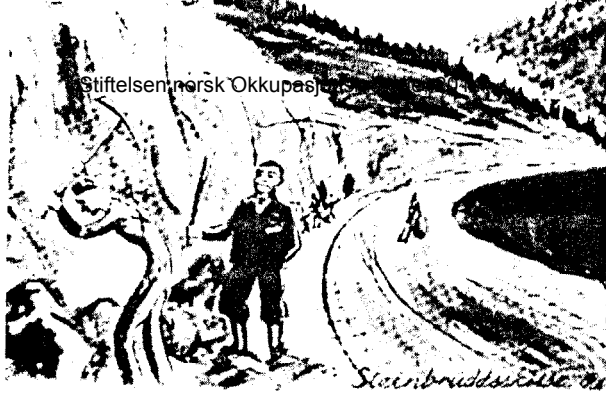
Steinbruddet i 1944