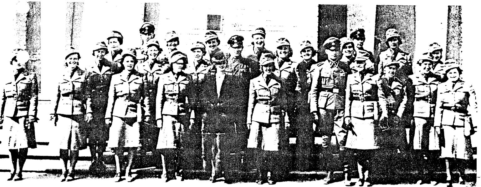
Den første kontingenten med frivillige norske RØDE KORS SØSTERE som reiste ut besto av 26. De kalte seg selv: "Jenter fra Den norske Legion, frivillige i kampen for det nye Norge."