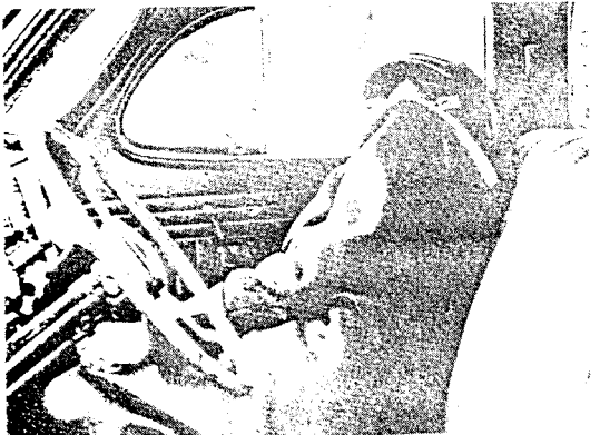
Siposjefens siste bilur.

1. februar likviderte folk fra Hjemmefronten generalmajor Karl A. Marthinsen, sjefen for Sikkerhetspolitiet. Han ble skutt i sin bil ved Blindern, utenfor Oslo, da han var på vei til kontoret om morgenen. Sjåføren ble nærst såret.