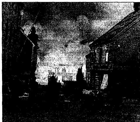
BOMBET: Mens Molde ble bombet sønder og sammen, slapp gullskatten unna uten en ripe i kjelleren til Oscar Hanssens konfeksjonsfabrikk.

Planen er å evakuere gullet sjøveien fra Åndalsnes. Togtransporten voktes av 30 norske soldater, blant dem dikteren Nordahl Grieg. Men da trans-