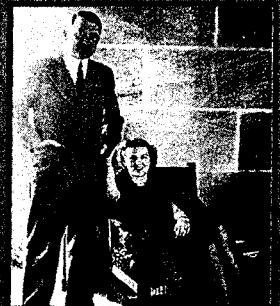
Adolf Hitler og Eva Braun giftet seg under sluttkampene i 1945. 39 timer etter begikk de selvmord.

het funnet 28 filmruller som tilhørte Hitles elskerinne Eva Braun. Vi får se klipp fra selskapsliv, Norges- og Italia-reiser og bade- og skiferier.