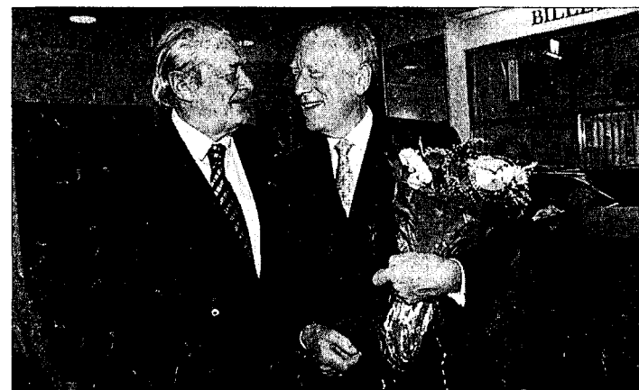
GODE VENNER: Erik Bye (t.v.) gratulerer sin gode venn Max von Sydow, som han hadde gledet seg til å se i rollen som Knut Hamsun.