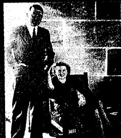
Adolf Hitler og Eva Braun giftet seg under sluttkampene i 1945. 39 timer etter begikk de selvmord.

het funnet 28 filmruller som tilhørte Hitlers elskerinne Eva Braun. Vi får se klipp fra selskapsliv, Norges- og Italia-reiser og bade- og skiferier.