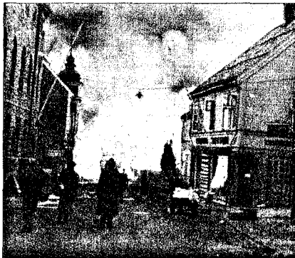
BOMBET: Mens Molde ble bombet sønder og sammen, slapp gullskatten unna uten en rype i kjelleren til Oscar Hanssens konfeksjonsfabrikk.

Planen er å evakuere gullet sjøveien fra Åndalsnes. Togtransporten voktes av 30 norske soldater, blant dem dikteren Nordahl Grieg. Men da trans-