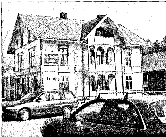
109933 FØDESTE- DET: Her, i andre etasje på Lundgaard i Leiret, ble Marie Ham- sun født 19. november 1881. Huset tilhører i dag Glomdalsmu- seet.

Elverum var et naturlig mål for en driftig forretningsmann i oppgangstidene i 1870-åra.