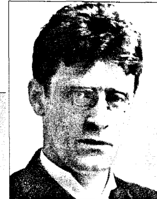
DEBATT: Ny uro rundt Knut Hamsuns navn. Arkitekturen på det planlagte Hamsunsentret vekker debatt.