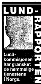
Lund-kommisjonen har gransket de hemmelige tjenestene i Norge.