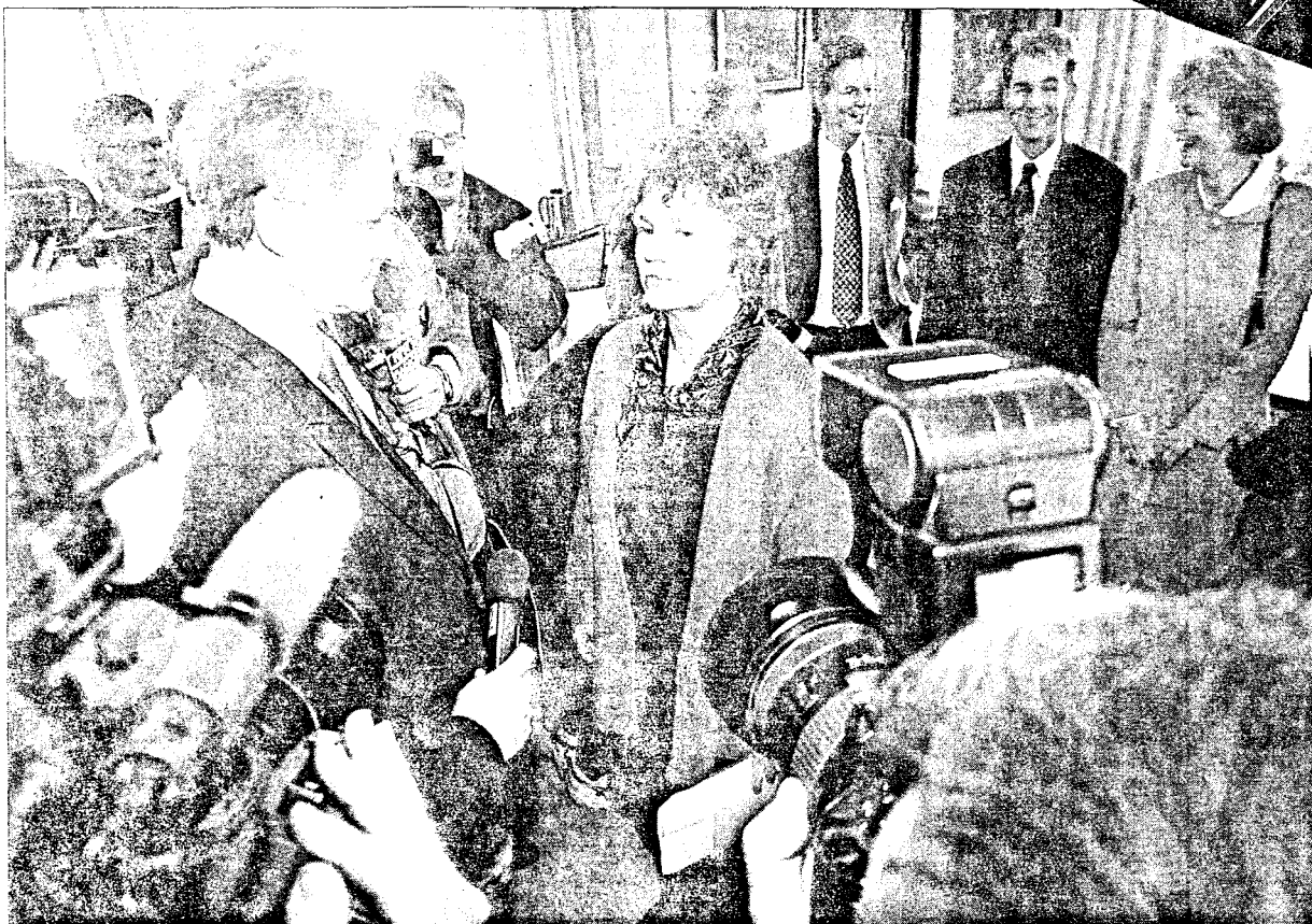
HEMMEG: Lund-kommisjonens leder Ketil Lund (til venstre) overleverte i går rapporten til Stortingets presidentskap ved stortingspresident Kirsti Kolle Grøndahl.