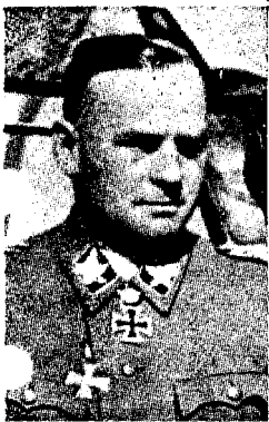
Divisjon Wikings første sjef SS-Obergruppenführer Felix Steiner, blankt frifunnet i Nürnberg.