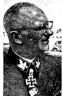
Wikings annen divisjonssjef, den høyt dekorerte «kjebespesialist» SS-Obergruppenführer Herberth Gille, også blankt frifunnet i Nürnberg.

Hvem er det som står bak alt dette, og hva er det en vil oppnå eller skal dekke øvet?