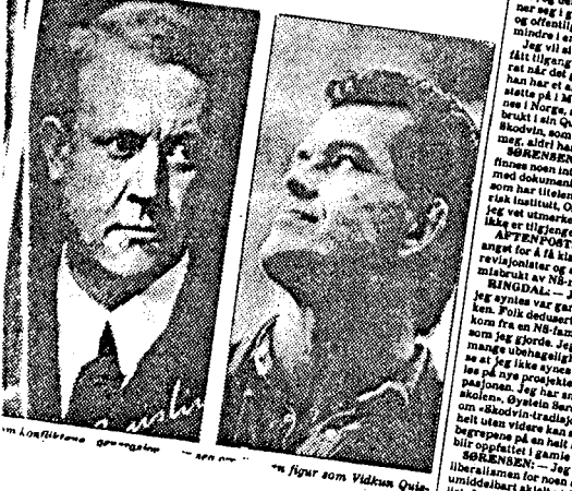
... som figur som Vidkun Quisling