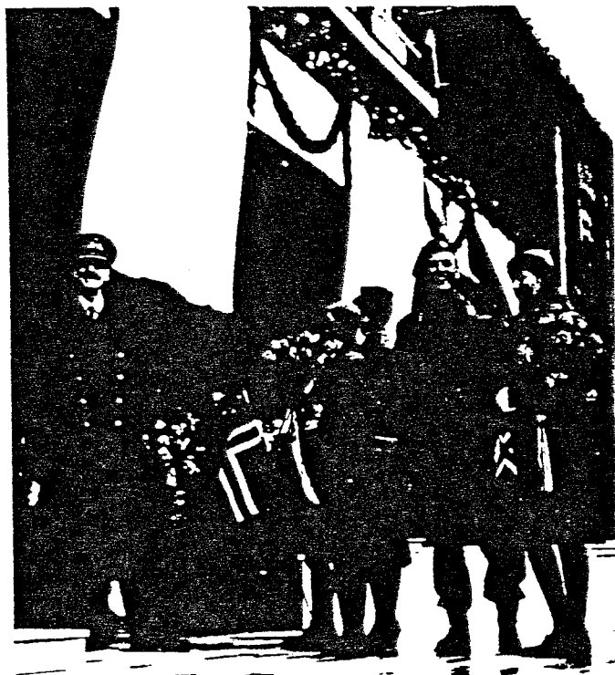
Kongefamilien ble ønsket velkommen tilbake til hjemlandet etter at krigen var slutt.

Det militære sluttoppgjøret i Norge var et resultat av den fullstendige tyske kapitulasjon i mai dagene 1945. Frigjøringen kunne derfor foregå på en fredelig og ordnet måte. På dette