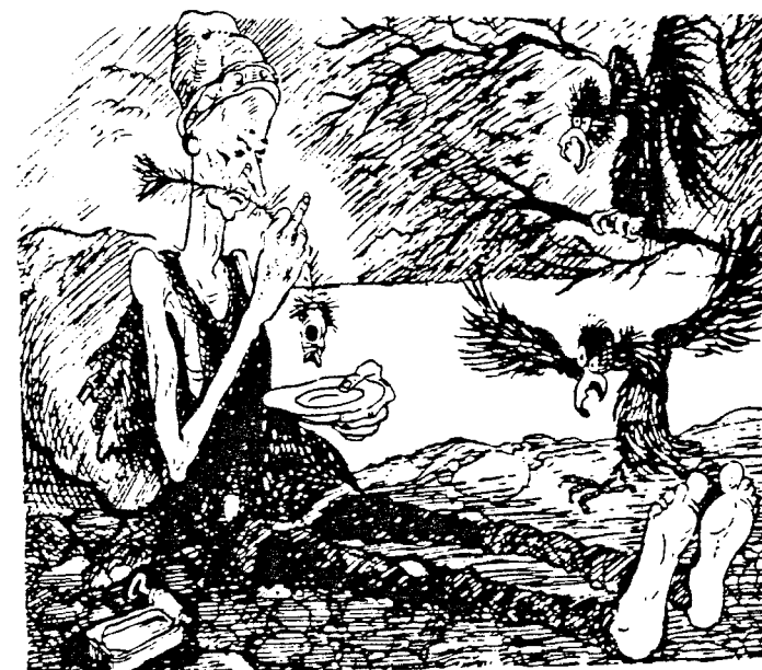
Einar minnes de harde tret- tiåra.

De fleste historikere som har skrevet om etterkrigstida, har lagt vekt på hurtigere forandringer og på økonomisk vekst og materielle goder. Det er blitt slutt på mellomkrigstidas masse- fattigdom, og sosiale reformer har gitt større trygghet. Norge har vært med på å nyte fordelene av den økonomiske opp- gangen i hele den industrialiserte verden. Det gjaldt særlig i de