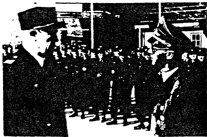
Terboven og Quisling foran en avdeling av NS-«hæren», Hirden. De to stod aldri på god fot med hverandre, men måtte utad tolerere hverandre.

I den uklare politiske situasjonen sendte Hitler en personlig