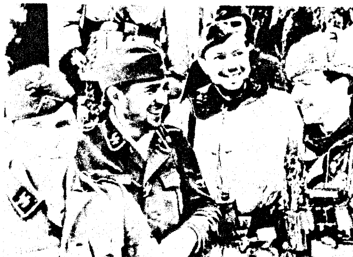
Eine Gruppe von SS-Grenadieren im Jahre 1944 trägt das neue Modell der Feldmütze, während einer von ihnen eine erbeutete sowjetische Wintermütze mit SS-Abzeichen trägt. Einige der Soldaten tragen die SS-Ausführung der speziellen Heeres-Winterkampf-Uniform.

Ein Zweites Mal in dem Buch des Engländers Andrew Mollo 1992 » Uniforms of the SS « Vol. 6