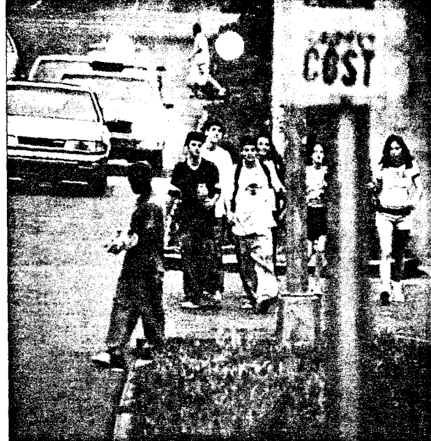
ROTLOSHET: Filmen «Kids» skapte sensasjon på Cannes-festivalen. Den viser ungdoms omgang med rus, kald sex og gruffull vold. Kynismen og mangelen på moralsk retningsans er det som slår en ved disse ungdommene. Vi ser de samme problemene hos oss, skriver Willy Pedersen.

«Viktigst i fortolkningen av de dystre linjene tror jeg det er at noe må ha gått tapt på veien. Hva var det Evang mistet av syne?»