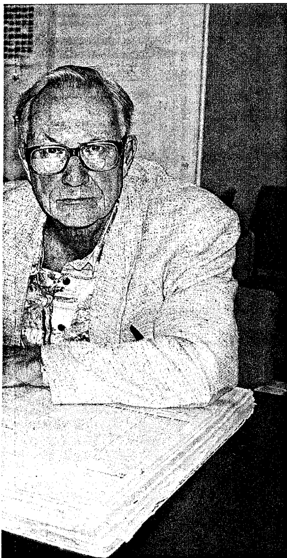
andets Blad fra krigens dager som bakgrunn for sine artikler om krigens hverdag i Ski.

skelige oppgjøre» som Rønneberg kaller det. Som i serien om hverdagen i Ski under krigen baserer han seg utelukkende på Østlandets Blads utgaver fra 1945 til 1952.