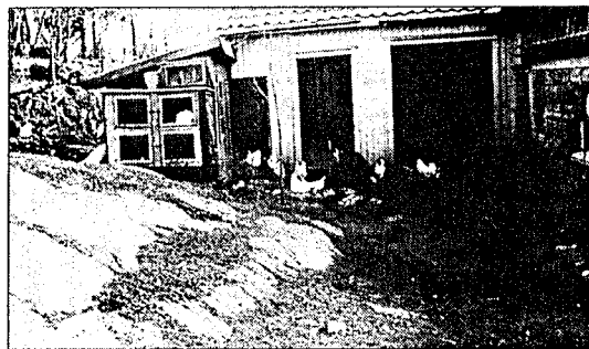
Matauk i Kråkstadveien 9. Bak kaninburet er grisehuset. Ellers sees høner, ender og kaniner. I fjøset til høyre var det sauer og geiter.

Østlandets Blad kom ut med fire sider hver mandag, onsdag og fredag i krigsårene. Hver uke krigen igjennom brukte avisen artikler og notiser om kaniner og kaninstell. Det ble 40-50 hvert år.