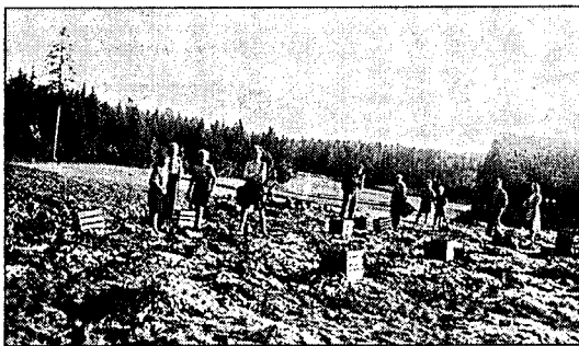
Potetopplak på Øvre Stuenes

En kampanje ble samtidig satt igang for kålroten - Norges apple! Den burde komme til heder og verdighet, ikke minst for spebarn og småbarn.