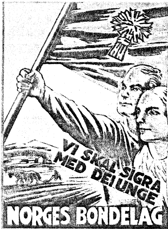
TIDSÅND: Disse to plakatene illustrerer tidsånden der et svært nasjonalromantisk syn på bondenæringen var felles for både Bondelaget og NS.