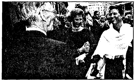
PÅ MIDDAG: Dronning Sonja og prinsesse Märtha Louise ble tatt imot av Gunnar «Kjakan» Sønsteby da kongefamilien kom til hjemmefrontledelsens store middag på Grand hotell i Oslo i går kveld.