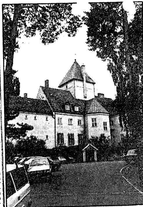
Det var här på Gimle det försiggick under kriget, säger ortsbefolkningen på Bygdøy och visar "Villa Grande", idag skola för vidareutbildning av sjukvårdspersonal.