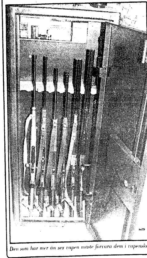
Den som har mer än sex vapen måste förvara dem i vapenskap.

Sveriges Vapenagareförening har adress: Box 7047, 700 07 Örebro.