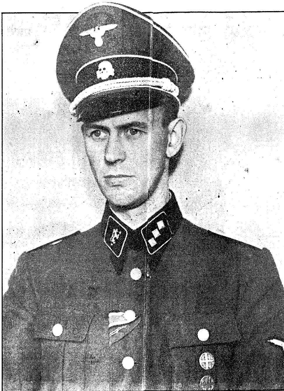
Chefen för Vidkun Quislings livvakt som ung soldat med järnkors och dödschallemärke i uniformmössan. Han vill idag som 67-åring inte