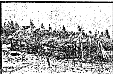
I denne seterbusa skjulte Rinnan seg. Solheim ga først ordre om skyting mot pipa for å skremme Rinnan ut. Det var ordre om å ta ham levende.