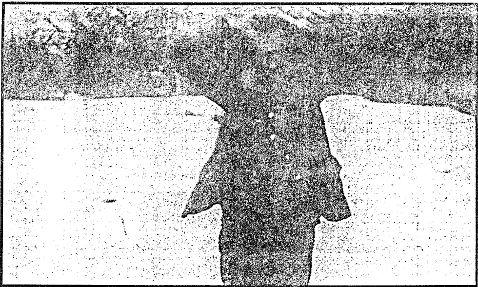
Henry Rinnan med hendene over hodet umiddelbart etter arrestasjonen.