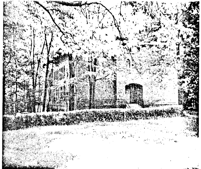
Friedhof der Division „Nordland“ (links) in Narwa 1944 und rechts im Jahre 1996.